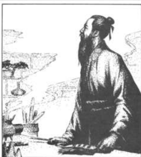
Figure 9.1 The portrait of Shen Kuo, a great scholar of Song Dynasty (ca. 960-1127).

Nieuwsgierige mensen kwamen van ver weg per boot, wachtend op een kans om de onvoorspelbare parel met eigen ogen te zien.